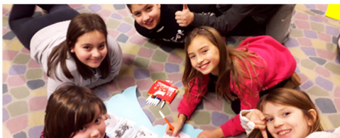
I ragazzi in attività durante il catechismo per la comunione in Ricreatorio San Michele.