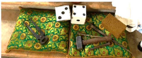
La tradizionale "Via Crucis dei segni" realizzata dai ragazzi di Muscoli durante il tempo quaresimale.