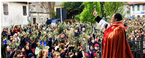
La benedizione degli ulivi il giorno delle Palme in piazza San Girolamo, alla presenza di tanti fedeli.